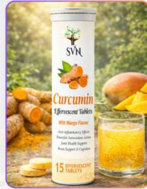
Curcumin EF Tablets 15

कवर्क्यूमिन EF टैबलेट्स मैंगो प्रलेवर युक्त एफर्वेसंट फ़ॉर्मूला है, जो सूजन कम करने व जोड़ों के स्वास्थ्य को सपोर्ट करने में सहायक है। पानी में घुलकर यह जल्दी अवशोषित होती है, इम्यूनिटी मज़बूत करती है और शरीर को ताज़गी व आराम देने में मदद करती है।