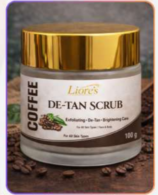
Liore's Detan Coffee Scrub 100g

कॉफ़ी डी-टैन स्क्रब एक एक्सफ़ोलिएटिंग स्किनकेयर फॉर्मूला है, जो टैन, डेड स्किन सेल्स और गन्दगी हटाने में मदद करता है। कॉफ़ी एक्सट्रैक्ट्स त्वचा को डीप क्लीन कर ब्लड सर्कुलेशन बढ़ाते हैं, जिससे ब्राइटनेस आती है। नियमित उपयोग से त्वचा स्मूद, फ्रेश और निखरी दिखती है।