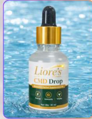
Concentrated Mineral Drops 30ml

CMD मिनरल ड्रॉप्स शरीर को आवश्यक मिनरल सपोर्ट देने वाला प्रभावशाली लिक्विड सप्लीमेंट है। यह ऊर्जा बढ़ाने, इम्युनिटी मज़बूत करने और मिनरल कमी पूरी करने में सहायक है। नियमित सेवन से शरीर का संतुलन बनाए रखने और समग्र स्वास्थ्य सपोर्ट में मदद मिलती है।