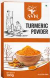
Turmeric Powder 100g