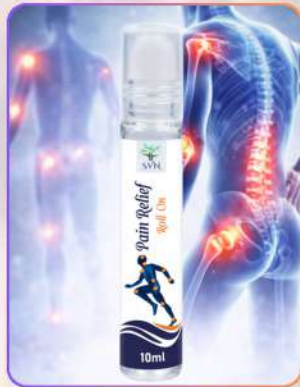
Pain Relief Roll On 10ml

पेन रिलीफ़ रोल ऑन मॉसपेशियो व जोड़ों के दर्द में राहत देने वाला प्रभावशाली फ़ॉर्मूला है। यह सूजन, जकड़न व थकान कम करने में सहायक है। रोल ऑन एप्लिकेशन से तुरंत ठंडक व आराम मिलता है। नियमित उपयोग से दर्द प्रभावित हिस्से को सुकून व आराम मिलता है।