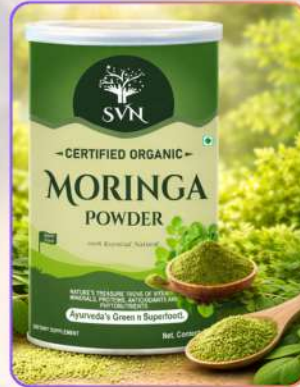
Organic Moringa Powder 100g

मोरिंगा पाउडर एक प्रमाणित ऑर्गेनिक सुपरफूड है, जो शरीर को आवश्यक पोषण देने में सहायक है। यह विटामिन, मिनरल्स, प्रोटीन व एंटीऑक्सिडेंट्स का समृद्ध स्रोत है। नियमित सेवन से इम्युनिटी मज़बूत होती है, ऊर्जा बनी रहती है और समग्र स्वास्थ्य संतुलन बनाए रखने में मदद मिलती है।