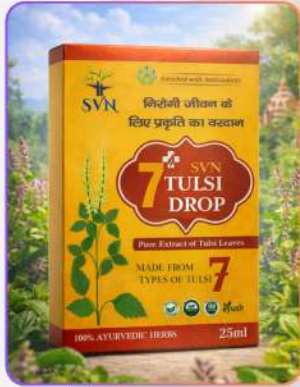
7+ Tulsi Drops 25ml

7+ तुलसी ऑयल फ़ॉर्मूला विभिन्न तुलसी अर्कों से तैयार है, जो इम्युनिटी बढ़ाने व सर्दी-खाँसी से बचाव में सहायक है। यह त्वचा एलर्जी, मुँहासे कम करने, श्वसन स्वास्थ्य सपोर्ट करने व बाल झड़ना घटाने में उपयोगी है। नियमित उपयोग से शरीर को समग्र हर्बल सुरक्षा मिलती है।