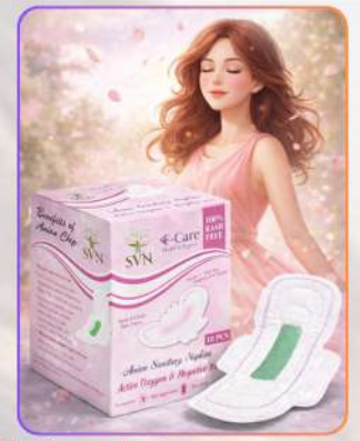
F Care Anion Sanitary Pads 8PCs

एँफ़ केयर सेनेटरी पैड्स अनायन तकनीक युक्त हैं, जो 99.9% बैक्टीरिया से सुरक्षा देने में सहायक माने जाते हैं। यह दुर्गंध व खुजली कम कर आराम प्रदान करते हैं। यूटीआई से बचाव में मदद करते हैं और लंबे समय तक ड्रायनेस व फ्रेशनेस बनाए रखकर दिनभर सुरक्षित अनुभव देते हैं।