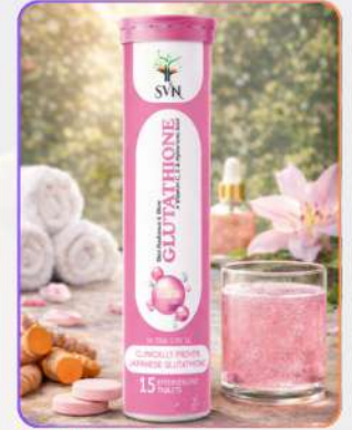
L Glutathione EF Tablets 15

एल-ग्लूटाथियोन EF टैबलेट्स ऑरिज प्रलेवर युक्त एफर्वेसंट स्किन सपोर्ट फ़ॉर्मूला है, जो त्वचा की ब्राइटनेस बढ़ाने व डिटॉक्स सपोर्ट देने में सहायक है। यह पिग्मेंटेशन कम करने, त्वचा निखारने और एंटीऑक्सिडेंट सुरक्षा प्रदान कर क्लियर ग्लोइंग लुक देने में मदद करती है।