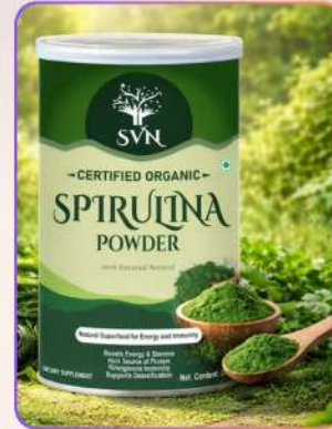
Organic Spirulina Powder 100g

स्पिरुलिना पाउडर एक प्रमाणित ऑर्गेनिक ग्रीन सुपरफूड है, जो शरीर को ऊर्जा व पोषण देने में सहायक है। यह प्रोटीन, विटामिन, मिनरल्स व एंटीऑक्सिडेंट्स का समृद्ध स्रोत है। नियमित सेवन से इम्युनिटी मज़बूत होती है, डिटॉक्स सपोर्ट मिलता है और सहनशक्ति बढ़ाने में मदद मिलती है।