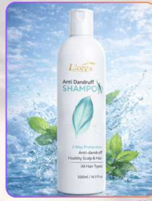
Liore's Anti Dandruff Shampoo 500ml

एंटी-डैंड्रफ़ शैम्पू एक सोम्य लेकिन प्रभावी क्लींजिंग फ़ॉर्मूला है, जो डैंड्रफ़ अतिरिक्त तेल और स्कैल्प की गंदगी हटाने में सहायक है। यह खुजली व जलन शांत कर स्कैल्प को हेल्दी रखता है। नियमित उपयोग से बाल मज़बूत, मुलायम, फ्रेश और शाइनी दिखते हैं।