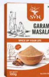
Garam Masala 100g