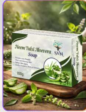
Neem Tulsi Aloevera Soap 100g

नीम तुलसी एलोवेरा सोप एक हर्बल बाथिंग बार है, जो त्वचा को साफ़, शुद्ध और सुरक्षित रखने में मदद करता है। नीम के एंटीबैक्टीरियल गुण, तुलसी के सुकूनदायक तत्व और एलोवेरा की नमी पिंपल्स, एक्ने व अतिरिक्त तेल को कम करने में सहायक होते हैं। नियमित उपयोग से त्वचा मुलायम, फ्रेश और हैल्दी ग्लो वाली दिखती है।