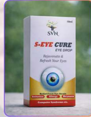
S-Eye Cure Drops 15ml

आई क्योर ड्रॉप्स आँखों की देखभाल के लिए तैयार प्रभावशाली आई केयर फ़ॉर्मूला है। यह आँखों की जलन, लालिमा और सूखापन कम करने में सहायक है। नियमित उपयोग से आँखों को ठंडक, ताज़गी और आराम मिलता है तथा आँखें साफ़ व फ्रेश महसूस होती हैं।