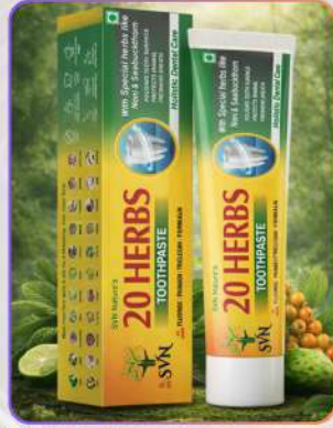
20 Herbs Toothpaste 150g

यह टूथपेस्ट गैनोडर्मा, नीम, लौंग, तुलसी, एलोवेरा, आँवला, सी बकथॉर्न, ग्रीन टी और एक्टिवेटेड चारकोल जैसे हर्बल तत्वों से बना है। यह दाँतों को साफ़ कर प्लाक से बचाता, मसूड़ों को मज़बूत बनाता और दाँतों की सफ़ेदी बढ़ाता है। इसके एंटीबैक्टीरियल गुण संक्रमण से सुरक्षा देते हैं और साँसों को ताज़ा रखते हैं। नियमित उपयोग से दाँत स्वस्थ और चमकदार बने रहते हैं।