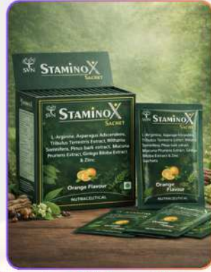
StaminoX Power Booster Sachet 10*15g

स्टैमिनॉक्स पावर बूस्टर सैशे ऊर्जा, स्टैमिना और वाइटैलिटी बढ़ाने के लिए तैयार प्रभावशाली फ़ॉर्मूला है। यह रक्त संचार सुधारने, शारीरिक क्षमता बढ़ाने और थकान कम करने में सहायक है। नियमित सेवन से परफॉर्मेंस, सहनशक्ति और समग्र पुरुष शक्ति सपोर्ट करने में मदद मिलती है।