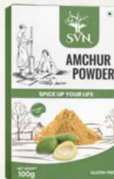
Amchur Powder 100g