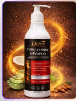
Liore's Conditioning Shampoo 300ml

कंडीशनिंग शैम्पू एक सोम्य क्लींजिंग फ़ॉर्मूला है, जो बालों से गन्धगी व अतिरिक्त तेल हटाकर उन्हें कंडीशन करता है। केराटिन व एलोवेरा ड्रायनेस कम कर फ्रिज़ कंट्रोल करते हैं। यह बालों को स्मूद मुलायम, शाइनी बनाकर ब्रेकेज से बचाने में भी सहायक है।