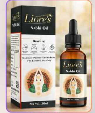
Liore's Nabhi Oil 30ml

नाभि ऑयल एक हर्बल केयर फ़ॉर्मूला है, जो त्वचा, बालों और समग्र स्वास्थ्य को सपोर्ट करने के लिए उपयोग किया जाता है। यह शरीर को पोषण देने, त्वचा नमी बनाए रखने और बालों की मज़बूती में सहायक है। नियमित उपयोग से संपूर्ण वेलेनेस संतुलन बनाए रखने में मदद मिलती है।