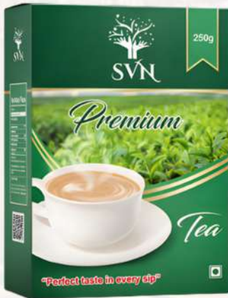
SVN Premium Tea 250g

SVN प्रीमियम चाय बेहतरीन गुणवत्ता, गाढ़े रंग और शानदार स्वाद का उत्तम संगम है। चुनी हुई उमदा चाय पत्तियों से तैयार यह चाय हर कप में ताज़गी और सुकून भर देती है। इसकी ख़ूब मन को तरोताज़ा कर दिन की शुरुआत को ख़ास बनाती है। दूध वाली चाय हो या कड़क मसाला चाय, हर अंदाज़ में इसका स्वाद लाजवाब लगता है। स्वच्छ और सुरक्षित पैकेजिंग में उपलब्ध यह चाय लंबे समय तक अपनी ताज़गी बनाए रखती है। SVN प्रीमियम चाय हर घूंट में 'पर्फ़ेक्ट टेस्ट' का भरोसा देती है।