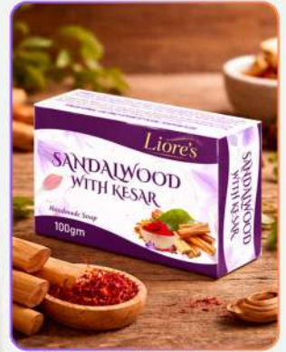
Sandalwood & Keser Handmade Soap 100g

केसर चंदन ग्लिसरीन सोप एक प्रीमियम हैंडमेड बाथिंग बार है, जो त्वचा को सौम्यता से साफ़ कर पोषण देता है। केसर व चंदन त्वचा की रंगत निखारने, टैन कम करने और टेक्सचर सुधारने में सहायक हैं। इसका ग्लिसरीन बेस त्वचा को मॉइस्चराइज़ कर मुलायम, स्मूद और नैचुरल ग्लो वाला बनाता है।