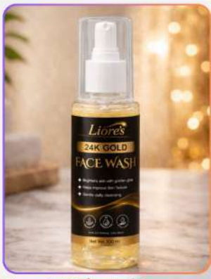
Liore's 24k Gold Facewash 100ml

24K गोल्ड फ्रेस वॉश एक सोम्य डेली क्लींजर है, जो त्वचा को साफ़, ताज़ा और नैचुरल ग्लो देने में सहायक है। गोल्ड एक्सट्रैक्ट्स गन्धगी व अतिरिक्त तेल हटाकर स्किन टेक्सचर सुधारते हैं। नियमित उपयोग से त्वचा ब्राइट, स्मूद, मुलायम और दमकती दिखती है।