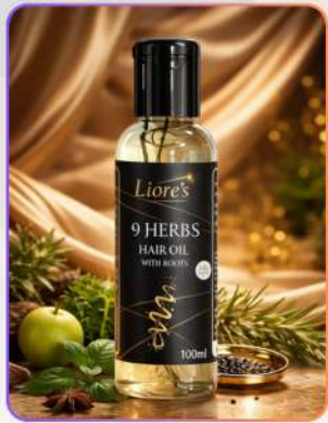
9 Herbs Hair Oil with Roots 100ml

9 हर्ब्स हेयर ऑयल बालों की ग्रोथ और स्कैल्प केयर के लिए तैयार पोषक हर्बल तेल है। यह हेयर फ़ॉल कम करने, डैंड्रफ़ कंट्रोल करने और जड़ों को मज़बूत बनाने में सहायक है। नियमित उपयोग से बाल मुलायम, घने, शाइनी और हैल्दी दिखते हैं।