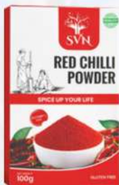
Red Chilli Powder 100g