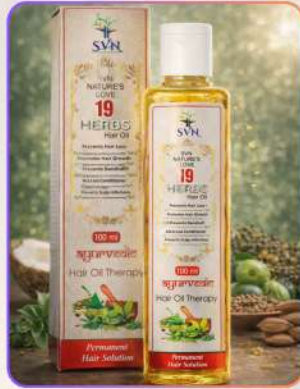
19 Herbs Hair Oil with Roots 100ml

19 हर्ब्स हेयर ऑयल प्राकृतिक हर्ब्स व ऑयल्स का समृद्ध मिश्रण है, जो बालों को मज़बूत, घना और स्वस्थ बनाने में सहायक है। यह जड़ों को पोषण देकर हेयर फ़ॉल कम करता, डैंड्रफ़ नियंत्रित करता और बालों की वृद्धि व चमक बढ़ाता है। नियमित उपयोग से बाल मुलायम व शाइनी दिखते हैं।