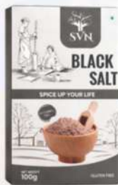
Black Salt 100g