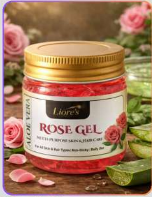
Liore's Rose Aloe Vera Gel 100ml

एलोवेरा रोज़ जेल एक रिफ्रेशिंग मल्टी-परपज़ स्किन और हेयर केयर जेल है। एलोवेरा और गुलाब के गुण त्वचा को हाइड्रेट, शांत और नैचुरल ग्लो देने में मदद करते हैं। इसका हल्का, नॉन-स्टिकी फॉर्मूला कूलिंग इफ़ेक्ट देता है, ड्रायनेस कम करता है और रोज़ाना इस्तेमाल से त्वचा व बालों को मुलायम, फ्रेश और पोषित बनाए रखता है।