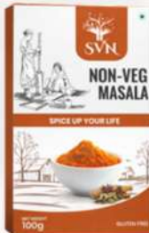
Non Veg Masala 100g