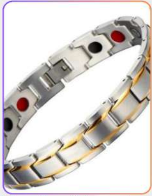
Premium Magnetic Bracelet

प्रीमियम मैग्नेटिक ब्रेसलेट मैग्नेटिक थेरेपी आधारित वेलनेस एक्सेसरी है, जो रक्त संचार सुधारने व शरीर की ऊर्जा संतुलित रखने में सहायक माना जाता है। यह थकान कम करने, जोड़ों की असहजता घटाने और समग्र आराम प्रदान करने में उपयोगी है। नियमित उपयोग से वेलनेस सपोर्ट मिलता है।