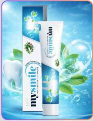
mySmile Toothpaste 100g

मायस्माइल मल्टी-एक्शन टूथपेस्ट दाँतों की संपूर्ण सुरक्षा के लिए तैयार एडवांस ओरल केयर फॉर्मूला है। यह जर्म्स से लड़कर कैविटी से बचाता और दाँतों को मज़बूत बनाता है। हर्बल एक्सट्रैक्ट्स प्लाक हटाकर मसूड़ों को स्वस्थ रखते हैं और साँसों को फ्रेश बनाते हैं। नियमित उपयोग से दाँत साफ़, मज़बूत और नैचुरली ब्राइट बने रहते हैं।