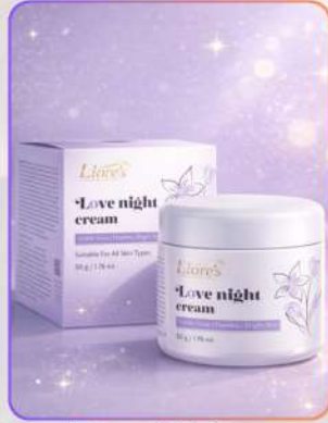
Liore's Love Night Cream 50g

लव नाइट क्रीम एक हल्की लेकिन रिच ओवरनाइट क्रीम है, जो सोते समय त्वचा को रिपेयर और पोषण देती है। यह गहराई से मॉइस्चराइज़ कर ड्रायनेस कम करती है और स्किन रिन्यूअल सपोर्ट करती है। नियमित उपयोग से त्वचा मुलायम, स्मूद, निखरी और सुबह फ्रेश दिखती है।