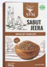
Cumin/ Jeera Whole 100g