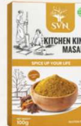
Kitchen King Masala 100g