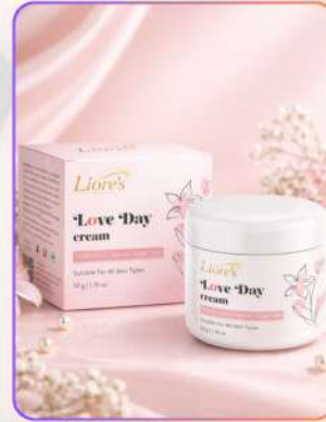
Liore's Love Day Cream 50g

लव डे क्रीम एक हल्की डेली यूज़ क्रीम है, जो त्वचा को दिनभर मॉइस्चराइज़, मुलायम और ग्लोइंग बनाए रखती है। यह डलेनेस कम कर स्किन टोन निखारती है। इसका नॉन-ग्रीसी फॉर्मूला जल्दी अवशोषित होकर त्वचा को फ्रेश, हैल्दी और बाहरी प्रदूषण से सुरक्षित रखने में सहायक होता है।