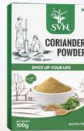
Coriander Powder 100g