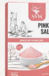
Pink Salt 100g